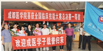
荣获全国临床技能大赛总决赛一等奖