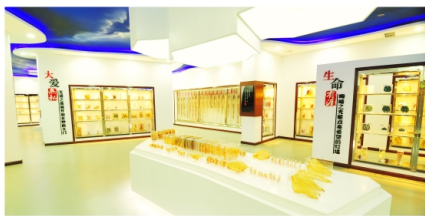
教育部医学人文素质教育基地人体生命馆

学校已建成省级、厅级科研平台15个，组建高水平研究团队11个。2005年以来，获得国家自然科学基金、国家社会科学基金立项115项。发表SCI、EI、CPCI-S收录的论文800余篇。青年教师的学术论文在Cell、Nucleic Acids Research等高水平学术杂志发表。《成都医学院学报》入选中国科技核心期刊，被评为中国高校优秀科技期刊。