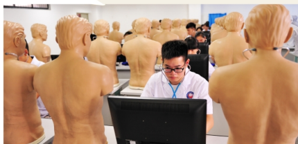
国家级临床医学实验教学示范中心

就业方向： 毕业生可到食品（保健食品）生产加工流通企业、食品药品检验所、工商行政管理部门、出入境检验检疫局、疾病预防控制中心、综合性医院营养科、以及学校、餐饮服务行业等从事食品相关检验检测、新产品研发、食品安全与质量控制、营养配餐与膳食指导等工作。