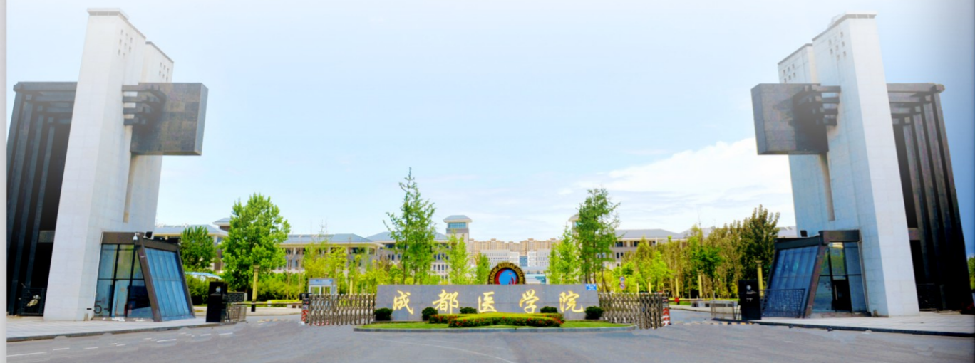
成都医学院2025届毕业生分省生源信息统计表（硕士）